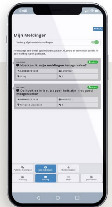
Een melding doen en delen is heel gemakkelijk. Al uw meldingen kunt u terugzien.